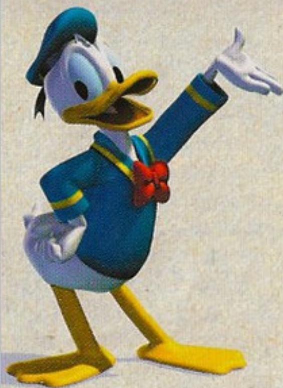
Donald posant pour la magazine "Nos Vedettes"

Le Journal de Donaldville – Collaboration Spéciale