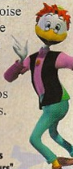
L'inventeur Géo Trouvetou dans "le Dictionnaire des Grands Penseurs"

à travers le monde, puis jusqu'au temple de Merlock pour sauver Daisy. Voici ce que Géo Trouvetou avait à nous dire : " Mon téléporteur sera capable d'envoyer Donald au temple de Merlock, sans problème. Mais premièrement, nous devons le rendre plus puissant. C'est pourquoi Donald parcourt le monde entier. Je ne peux vous en dire plus que ça... " Rappelons que Daisy est portée disparue depuis hier (voir notre article du 05 juin). Tout laisse croire qu'elle est maintenant la prisonnière de l'effroyable Merlock. Le monde entier se croise les doigts pour que l'infatigable Donald parvienne à la sauver. Plus de détails dans nos prochaines éditions.